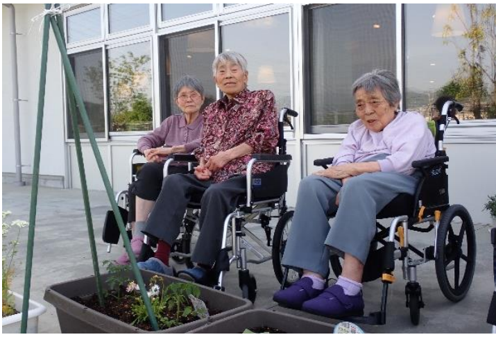
麻の葉グループ農園！今年も始動