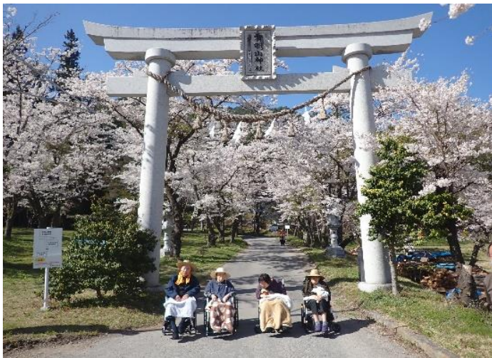
有明山神社の桜 ご利益が有りますように!! 撮りますよ～～”ハイポーズ”