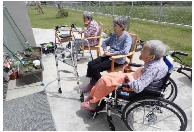
さてさて、甘いメロンは出来るか否か… 毎日、水やり・見守りしています。