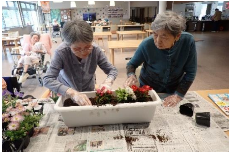
”きれいに咲いて” 願いを込めて