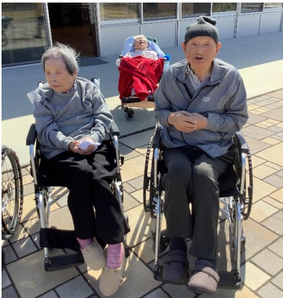
暖かい日は、 外気浴でリフレッシュ