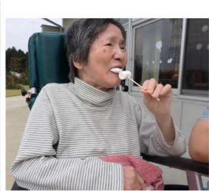
芋を丁寧に包んでいただきました