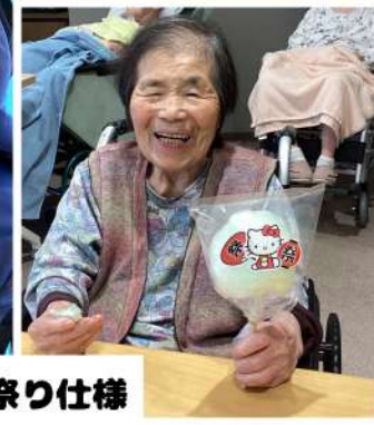
袋のデザインもお祭り仕様