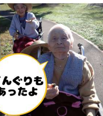
どんぐりも あったよ