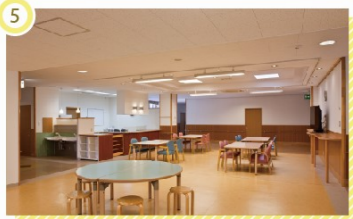
桜木町 デイルーム

ひまわりの丘 デイルーム 自然の光があふれるオープンスペースは、潤いあるコミュニケーションを促す大切な空間となっています。また食事も兼ね、管理栄養士がご利用者に合わせたメニューを立て、委託業者により施設内で調理した食事を提供しています。