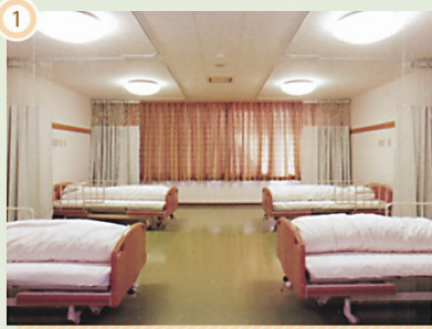
ひまわりの丘 4床「すずめ」