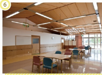
こすもすの里 デイルーム 機能回復訓練室