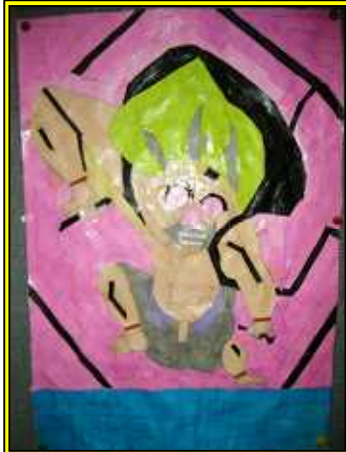
男性ご利用者さんの作品です。右は、水彩画。左は、貼り絵。左手で細かく描かれており、色合いがきれいです。