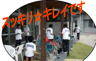
スツキリ★キレイです

高瀬中学校の生徒さんが ボランティアにきて下さっています。明るい中学生を見ている利用者さんの表情はにこやか。若いパワーをもらい明日からまた元気になります。