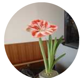
ライフで咲いた 胡蝶蘭