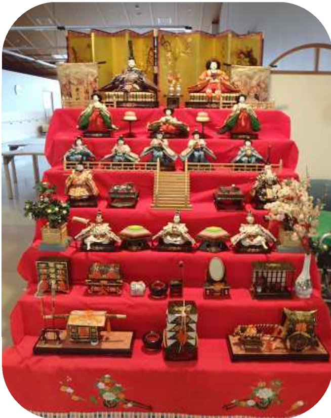
3月 ひな祭り 昨年松川のご利用者のご家族より 立派な段飾りを頂きました。 若いスタッフ達が四苦八苦しなが ら飾りつけました。 ご利用者も職員も前を通るたびに うっとり眺めます。