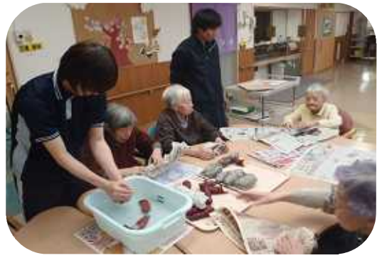
秋 焼き芋大会 皆で準備して美味しいお芋が焼けました