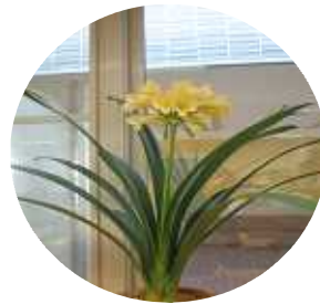
君子蘭と アマリリス