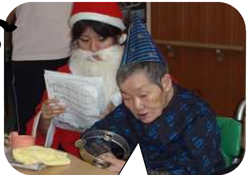
私もいっちょ 盛り上げるよ