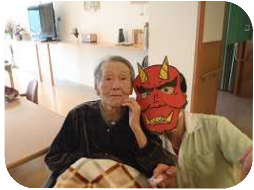
2月 節分 豆まき 今年も赤鬼、青鬼がライフにもやって来ました 皆さんに福が来ますように！！