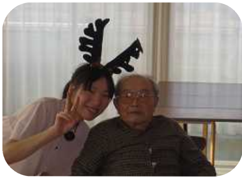
サンタにトナカイも 参加して 大にぎわい