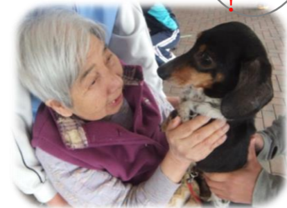
お前さん、よく来たな～