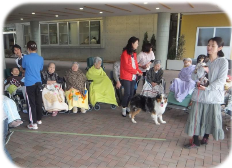
動物たちの持つ力は計り知れないですね