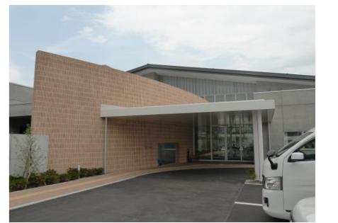
ライフ松川正面玄関