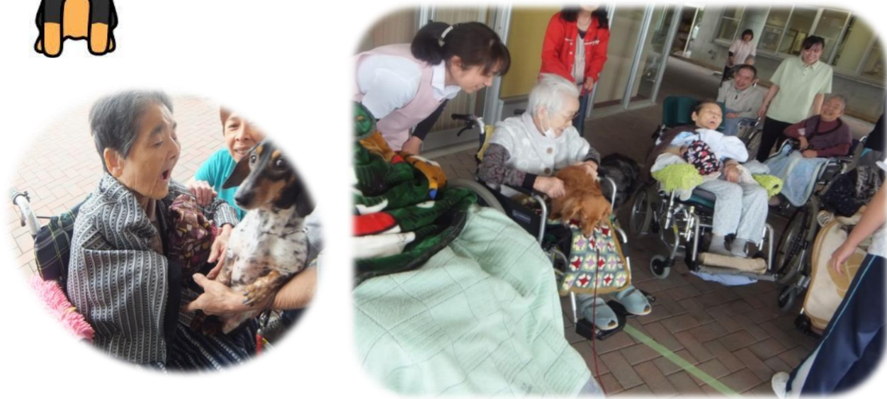
今年も癒しの天使たちが会いに来てくれました