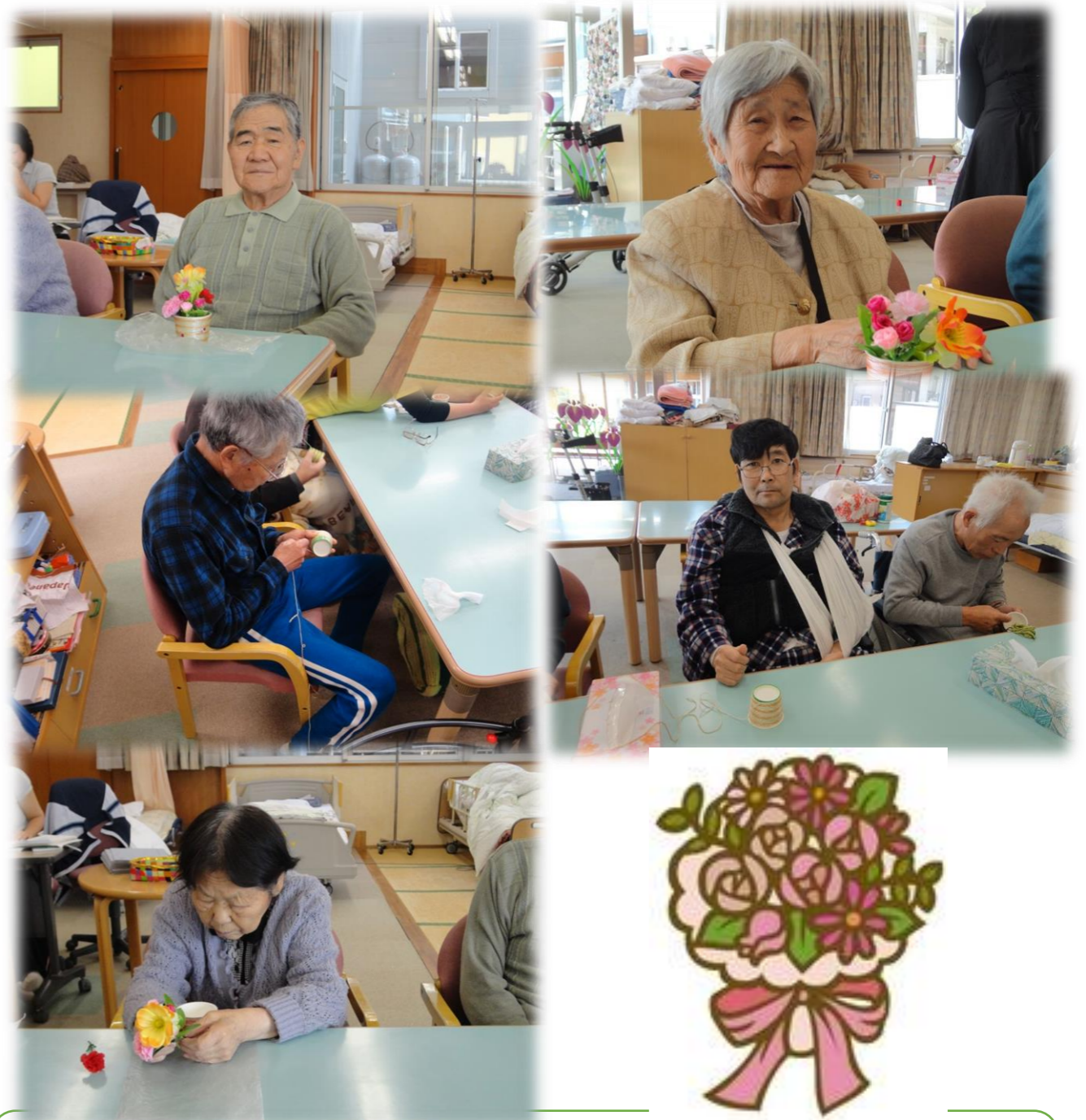
キューピーのお洋服を作ったり、カップに綺麗なヒモを巻いて飾り付け！！