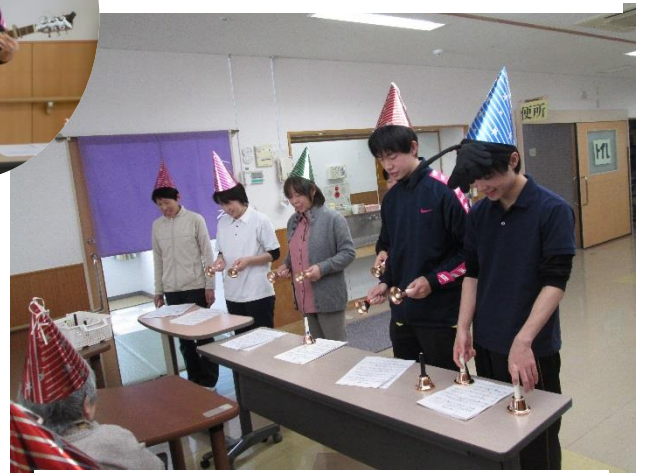
職員によるハンドベル演奏会