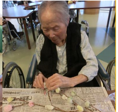
ひとつひとつ心を込めて