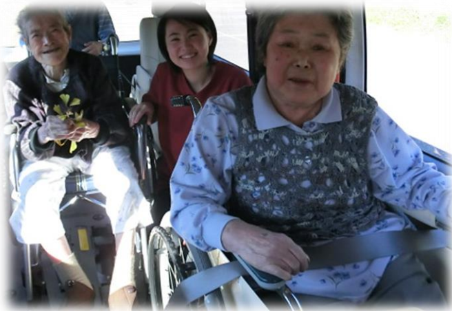
みんなでドライブ！季節を感じてきました