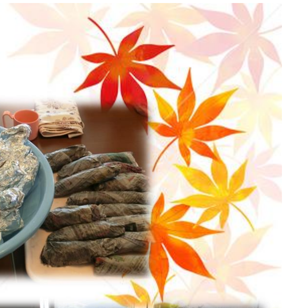
みんなで協力して準備しました