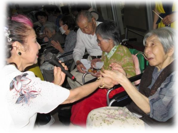
今年はいにくの雨でしたが いつもより近くで楽しんでいただきました