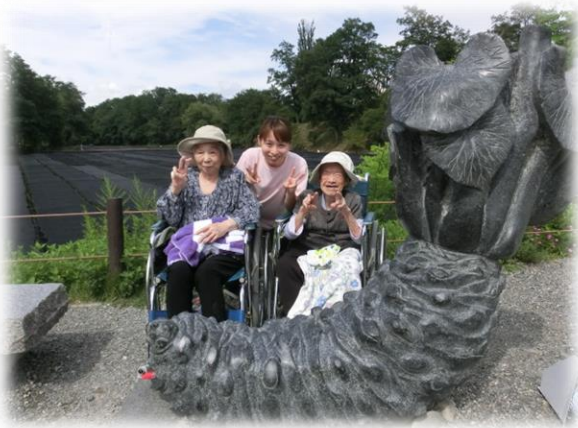
大王わさび農場に行きました