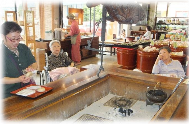
あづみ堂におやきを食べに行きました