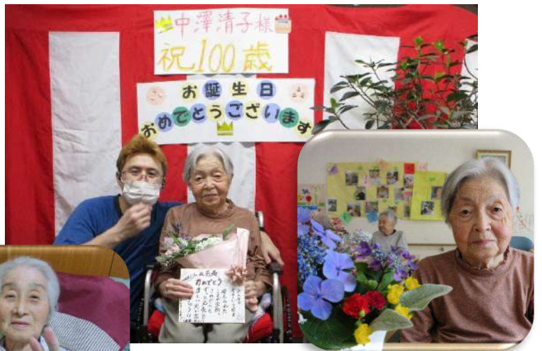
桜木町グループは色紙でお祝いしました おめでとうございます 🌸

池田町 ショッピングタウンに 買い物に 出掛けています 🚗 好きな物が購入できて ご満足いただけました 😊