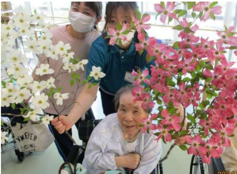
ハナミズキで撮影会をしました 😊