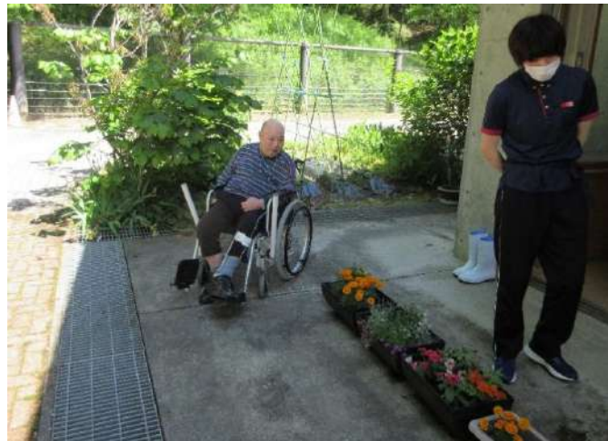
外散歩は気持ちがいいですね 😊 今年も畑で野菜を作りました 🍅 🥒