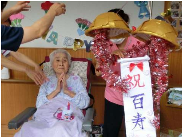
こすもすグループはくす玉でお祝いしました おめでとうございます 🌸