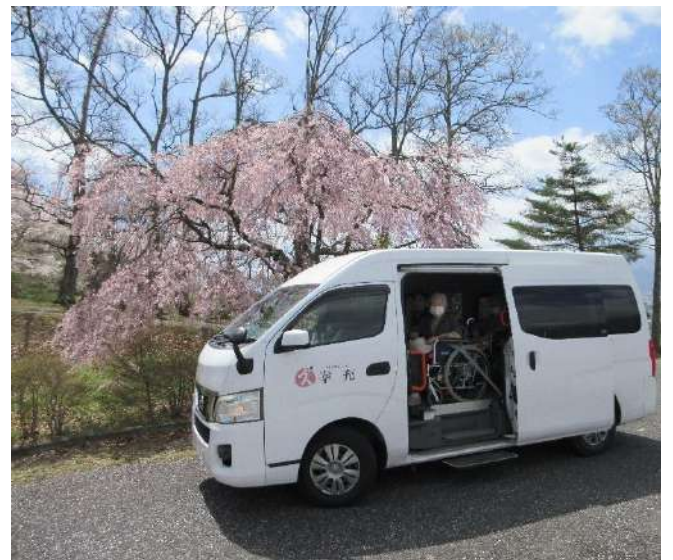
♪クラフトパークに出掛けました 😊🎵