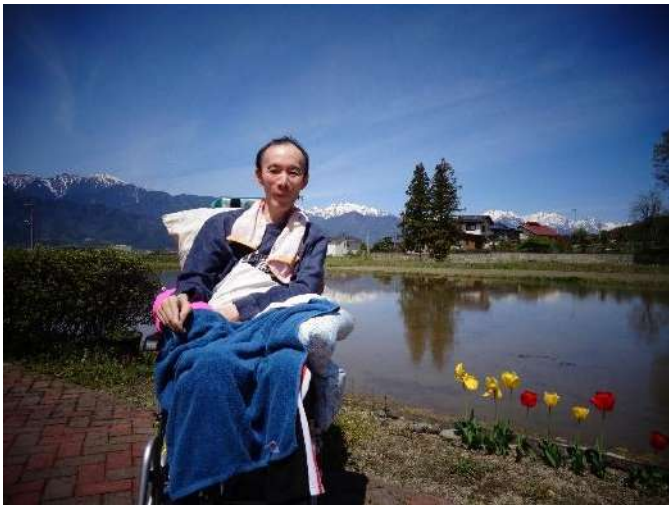
ライフから眺める山の景色は最高です 😊