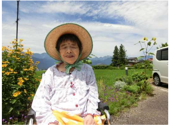
麦わら帽子が良くお似合いです 😊