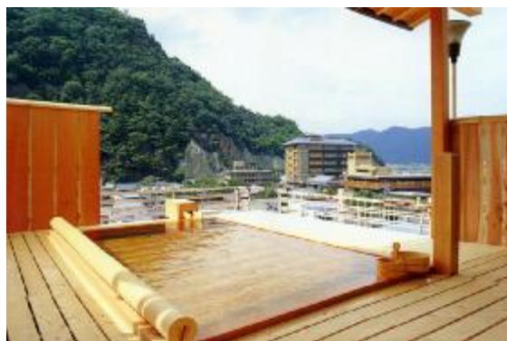
「荻原館」の露天風呂