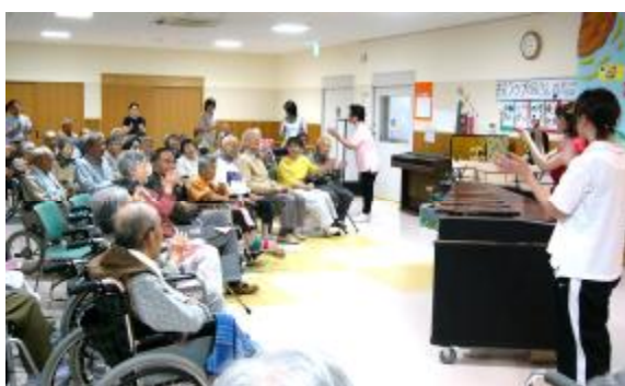
幸せなら手をたたこう