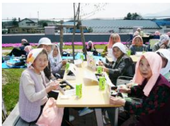
屋上庭園でのお弁当

また、池田のやすらぎの郷、松川の権現様・ちひろ美術館等に出かけ満開の桜の下でお茶を飲んでいただきました。