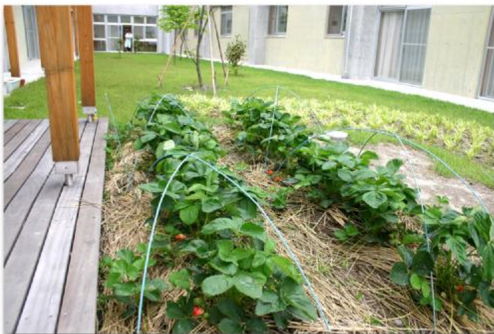
ライフ2 第2ユニット「つばくろ通り」南側のいちご畑