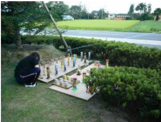
花火の準備中・・・