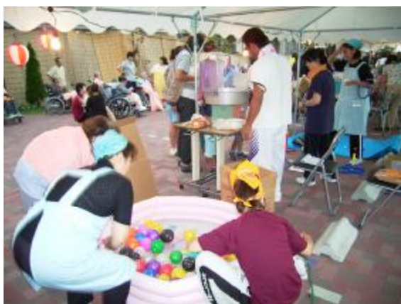
ボンボン作りも手慣れたもの