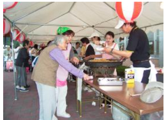
タカミロさんのご協力をいただきました