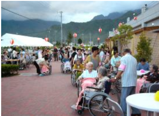
ボランティアの皆さんのご協力もいただきました。