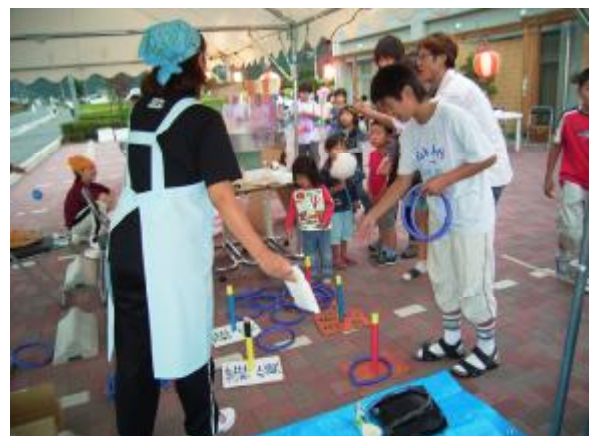
いいものねらって…