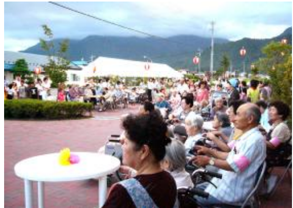
あとは開祭を待つばかり