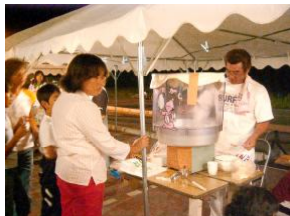
輪投げの景品、綿菓子