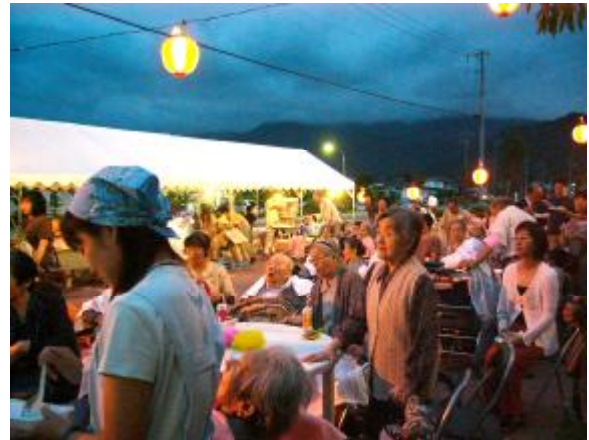
いよいよライトアップです