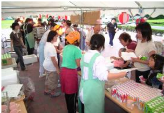
行列のできた『うまいものや』