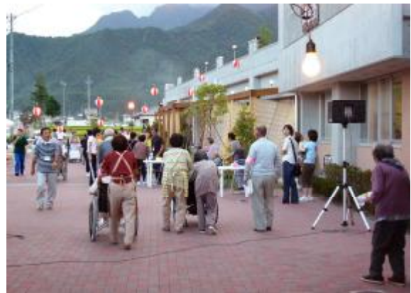
「今日は外でできて良かったねェ」