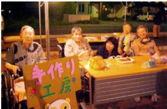
利用者さんが売り娘に変身