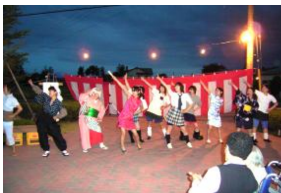
信濃の国のコスプレダンス