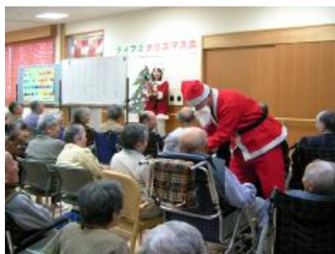
北保育園でのクリスマス会