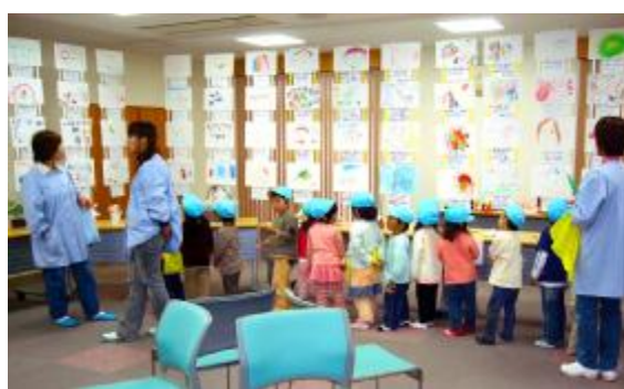
うしろの作品は園児の絵