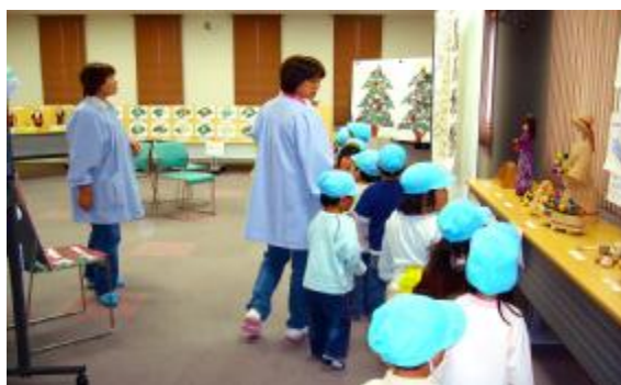
北保育園、園児が訪問

各クラブの作品はもちろんのこと、更に昨年から交流を行っている松川北保育園の園児の皆さんのかわいらしい絵が花を添え、大好評のうちに終わりました。