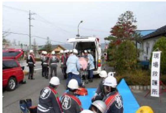
負傷者の搬送訓練