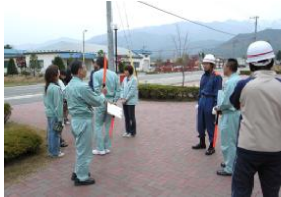
つばくろ電機の人たちも参加