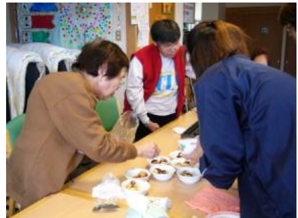
ソース、青海苔、かつぶし