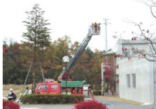
はしご車での救出