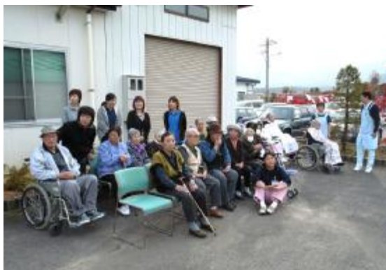
つばくろ電機敷地に避難して