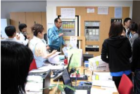
火災感知・通報装置の説明

11月11日 秋の消防避難訓練が行なわれました。北アルプス広域消防、松川村消防団の皆さんに加えて、お向かいの「つばくろ電機」従業員の方々も参加され合同の訓練となりました。火災通報、消防車到着、居住者の避難誘導、屋上からの救出、周辺の交通整理、負傷者の搬送などが分担して行なわれました。万一の場合にも迅速かつ適切に行動したいものです。