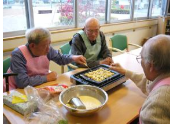
まわりをきれいに入れて、