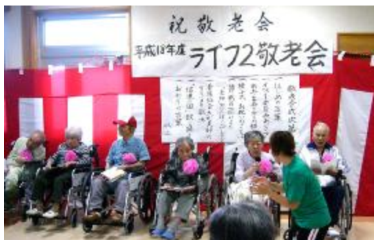
喜寿、米寿、上寿のみなさん

ことし、喜寿、米寿、上寿を迎えられたご利用者の皆さんに、施設長より賞状、色紙が手渡されました。通所スタッフや看護協会の皆さんによる歌、信濃の国ダンスなどで楽しんでいただきました。