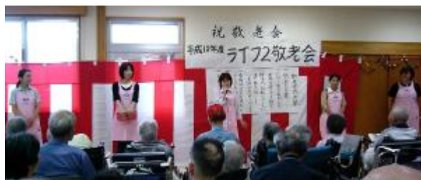
看護協会のみなさんの歌