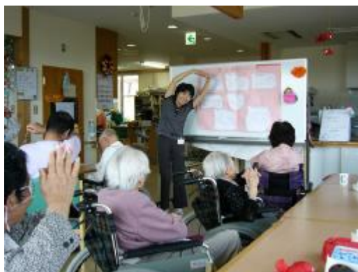
嚥下体操、首と肩のストレッチ