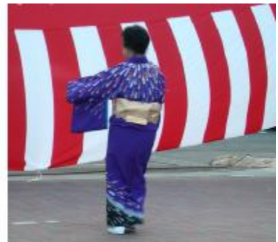
松川村芸能ボランティア「コスモス」さん