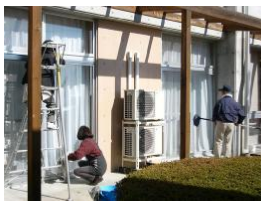
松川村 民生児童委員のボランティア活動