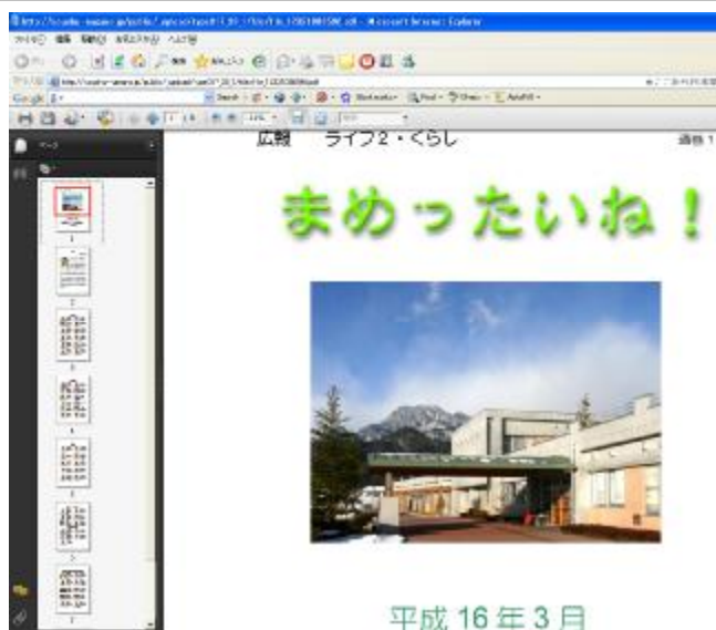
これは平成16年3月の創刊号。左側に各ページの縮小版が表示されています。