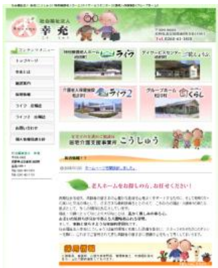
幸充の最初のページが表示されます。