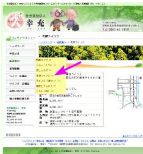
「施設案内」にカーソルを置くと、各施設のタグが出てきます。