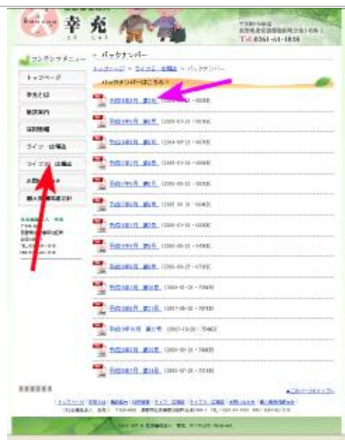
「ライフ2広報誌」をクリックすると、「まめったいね」のバックナンバーを閲覧できます。