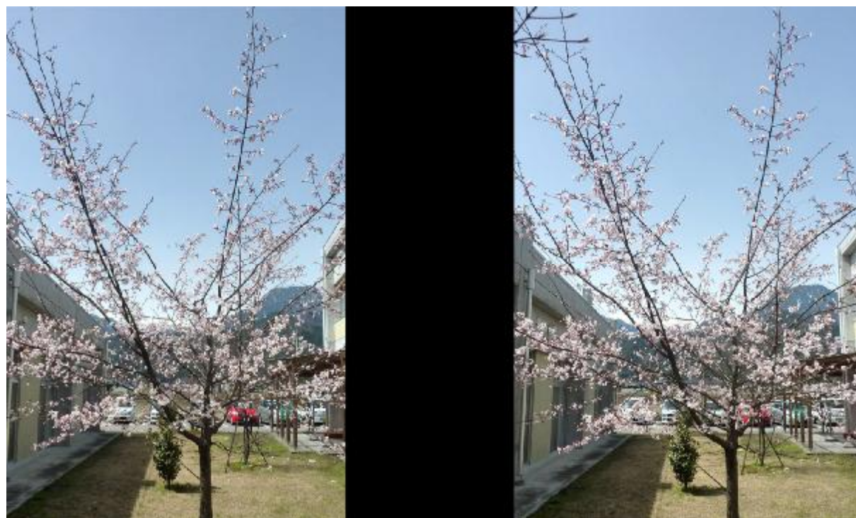
ライフ2中庭の桜、3D写真。見方の説明は8ページ。