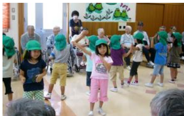
7月7日 ライフ2にて七夕祭り