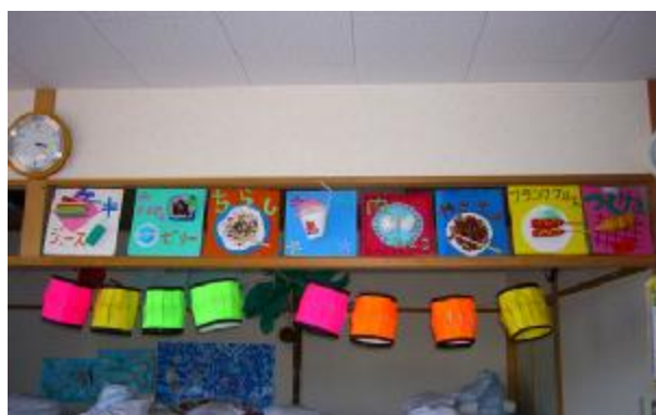
8月5日 納涼祭出店看板作り