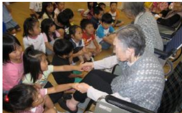
6月23日 北保育園にて