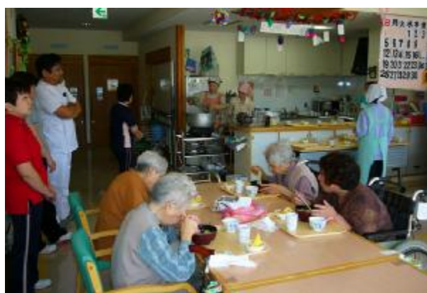
9月17日 出前調理、ラーメン