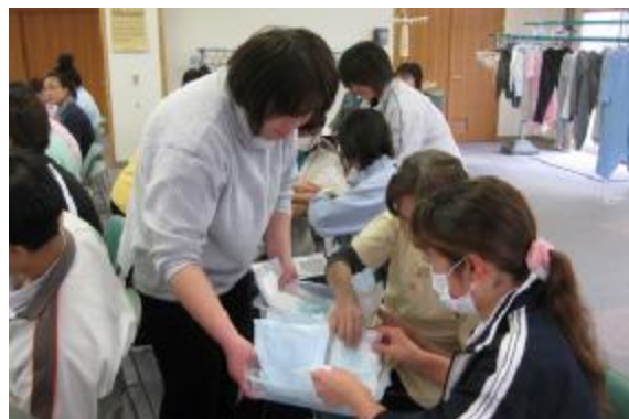
「介護技術の再学習」 2月9日、16日

パッドやオムツには様々な種類があります。実際に水を吸収させて比べることで、機能の違いを実験しました。症状や目的によって使い分けること、機能に応じた正しい当て方がよく理解できました。