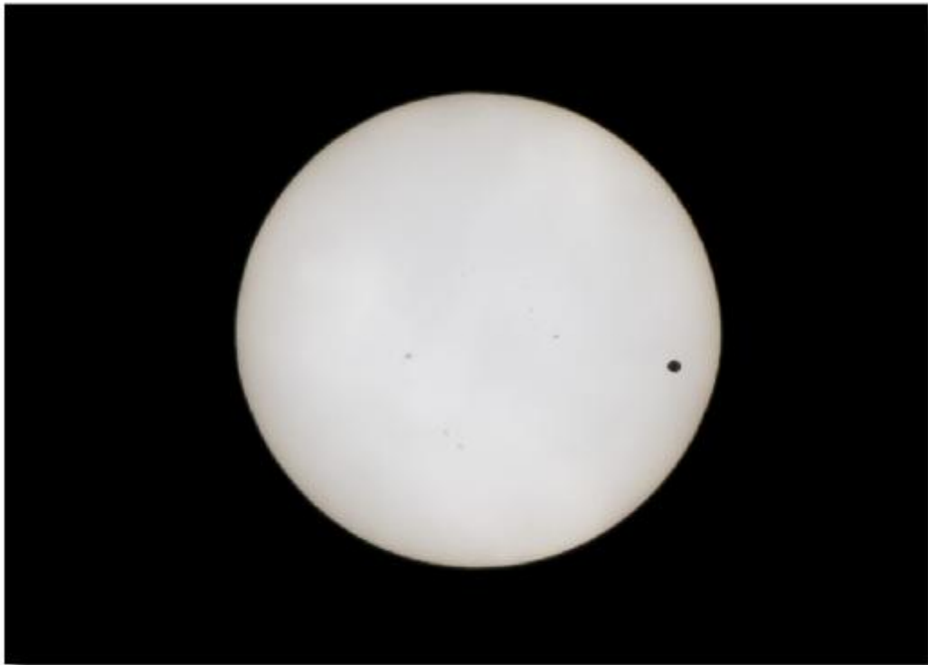
写真は2012年6月6日 金星の太陽面通過です。12:45撮影