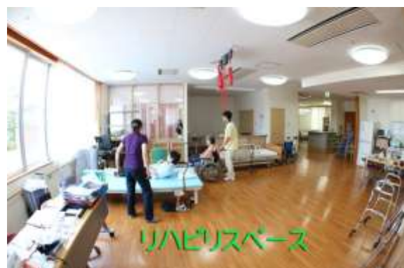
リハビリスペース