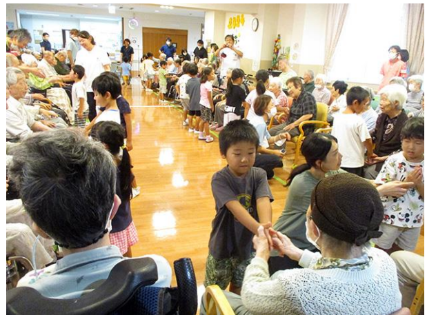
松川南保育園の園児が訪問して、入所者さんと交流しました。