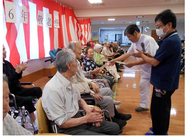
節目のお祝いの色紙を手渡し